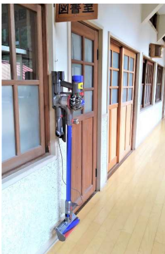
コードレス掃除機 1階廊下に2台配備 2階廊下に1台配備