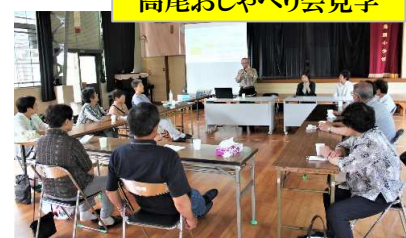
高尾おしゃべり会見学