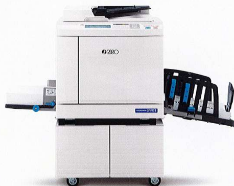
デジタル印刷機 RISO RISOGRAPHSF935 II