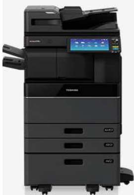
白黒コピー機 TOSHIBA eSTUDIO2518A