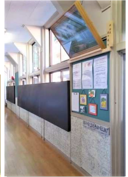
1階、廊下の掲示用黒色ボード