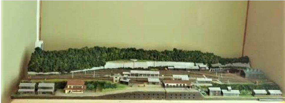
備後落合駅のジオラマ 昭和45年当時 縮尺150分の1(2階⑤)